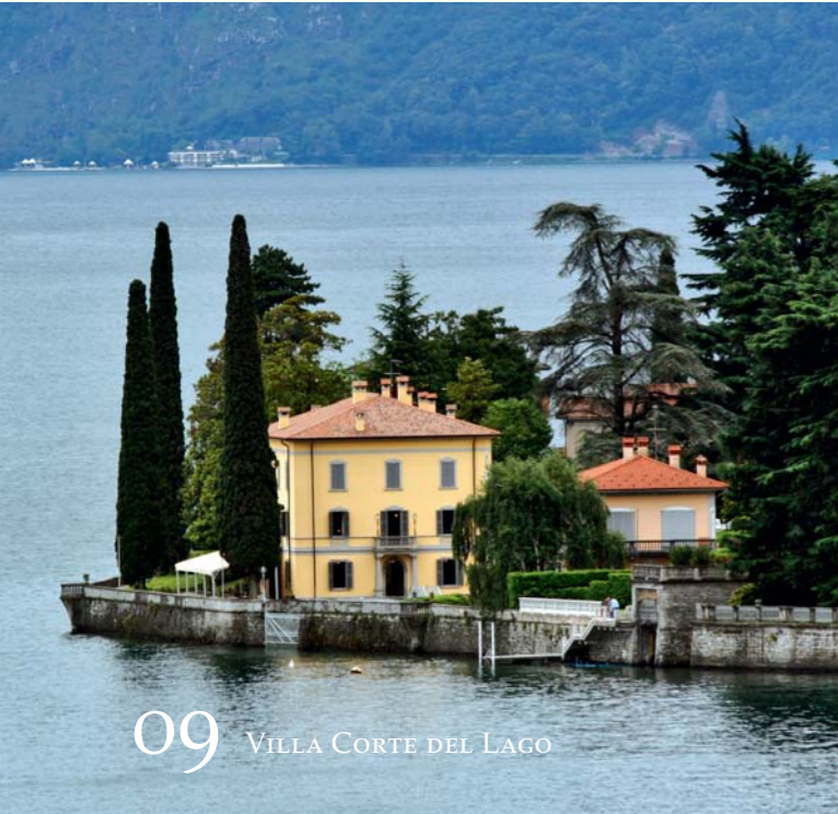
09 VILLA CORTE DEL LAGO