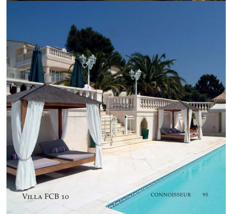
VILLA FCB 10