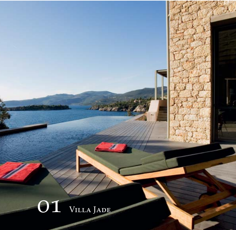
01 VILLA JADE