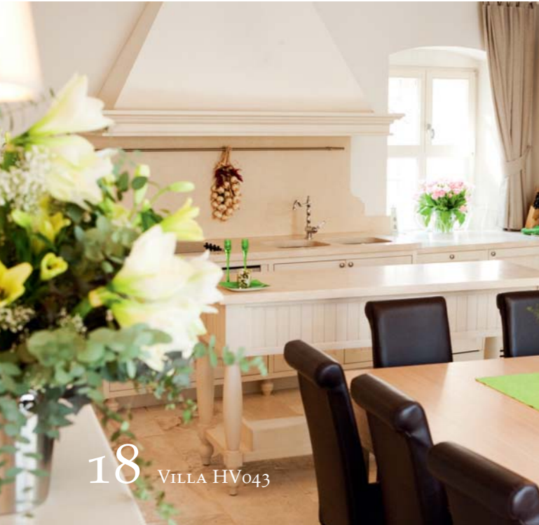
18 VILLA HV043