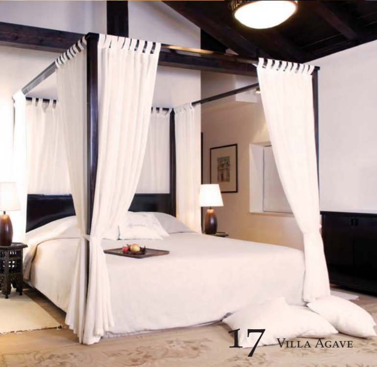
17 VILLA AGAVE