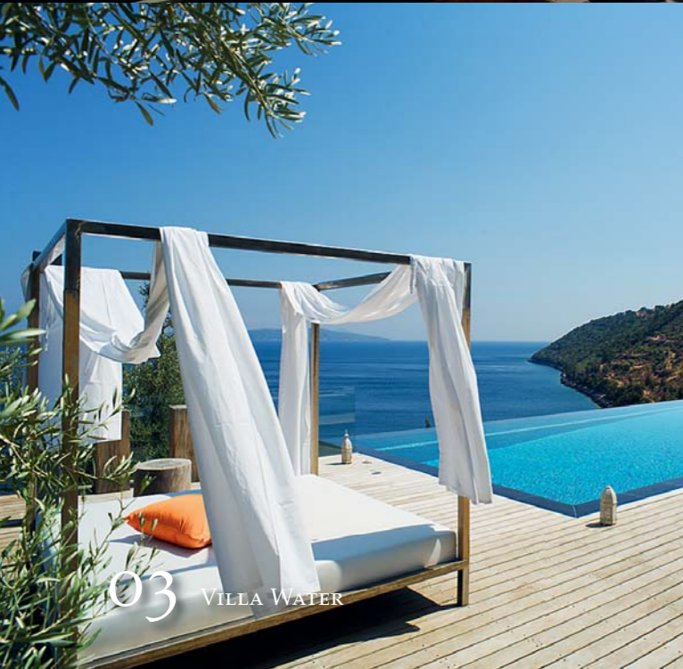
03 VILLA WATER