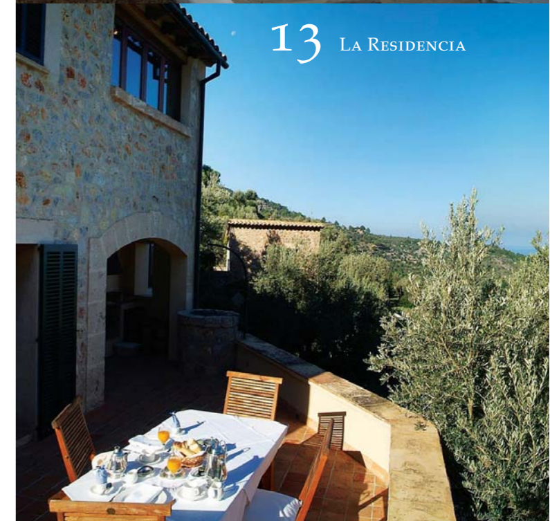
13 LA RESIDENCIA