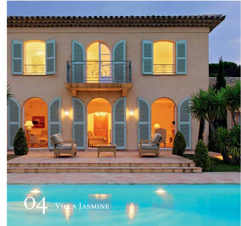
04 VILLA JASMINE