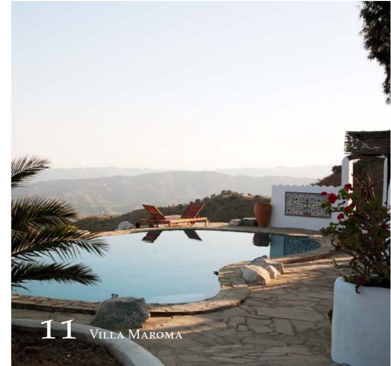
11 VILLA MAROMA